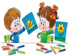
Immagini, suoni e colori