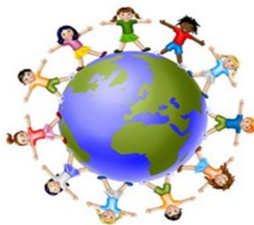
La conoscenza del mondo