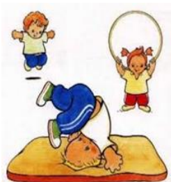
Corpo e movimento