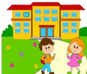
Il sé e l'altro